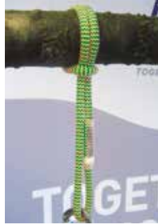
pic. 3: Constriction loop

Sirius Loop 10mm P-S (art. no. 7351152) and Sirius Loop 10mm P-L (art. no. 7351151), respectively, are replacement parts of Teufelberger's pulleySAVER. In this case, they are used as prusik loops. For detailed information on how to mount it properly, please consult the Manufacturer's Information document provided with the pulleySAVER.