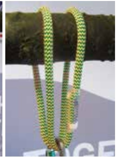
Abb. 2: als Doppelschlinge